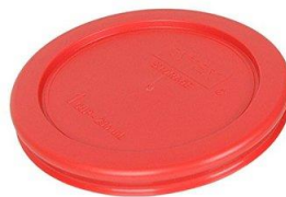
Objeto redondo del hogar (tarro, plato, tapa, etc)