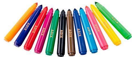
Plumón, lápiz o marcador.