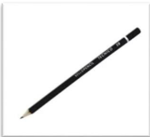
Lápiz para marcar.