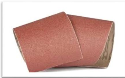
Trozo de lija.