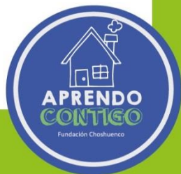
TABLA DE COLORES